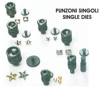
PUNZONI SINGOLI SINGLE DIES