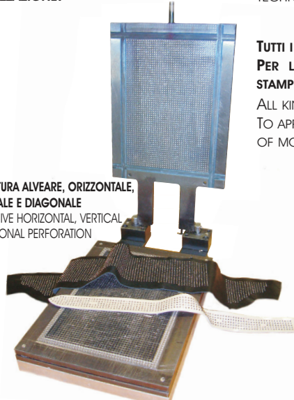
STAMPI CON FORATURA ALVEARE, ORIZZONTALE, VERTICALE E DIAGONALE PLATES WITH BEEHIVE HORIZONTAL, VERTICAL AND DIAGONAL PERFORATION

TUTTI I TIPI DI BORCHIE POSSONO ESSERE APPLICATI UNO AD UNO CON UN PUNZONE. PER L'APPLICAZIONE DELLE STESSO CON METODO INDUSTRIALE DISPONIAMO DI STAMPI E MACCHINE AUTOMATICHE.