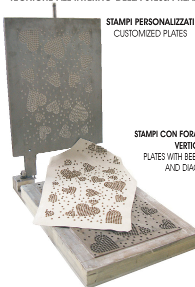
STAMPI PERSONALIZZATI CUSTOMIZED PLATES

ALL THE PROCESSES MUST BE APPLIED ON OPEN PARTS OF GARMENTS, EXCEPT FOR SOME PARTICULAR CASES IN WHICH IT IS POSSIBLE TO PERFORM THEM DIRECTLY ON THE FINISHED GARMENTS, DEPENDING ON THE CLIENT'S PROJECT. THE VERSATILITY OF THIS WORKMANSHIP ALLOWS THE COMBINING OF MORE TECHNIQUES IN THE SAME PRODUCT.